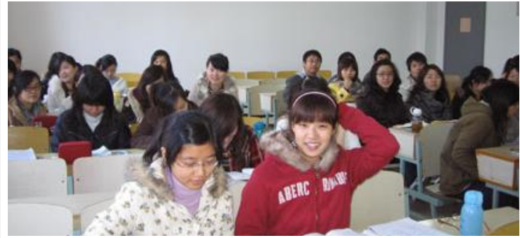
日本語学校の教室で