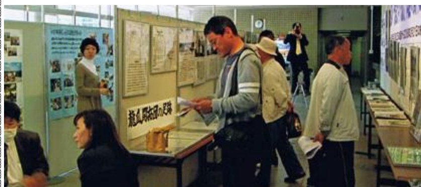
熱心に参観する人々

◎ 戦争の本当の悲劇が67年経っても続き、キズは永遠に消えない。決して戦争してはいけないと同時に国家とは何か、国家の責任あるべき形をせめなければならぬと思う。(70代の男性)