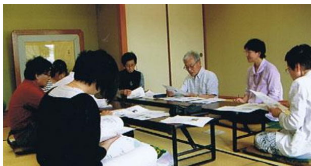
憲法雑談会岡輝公民館にて

次回の新聞送付作業は7月22(月)午後1時半、民主会館2階で行います。前回お手伝いくださった方です。