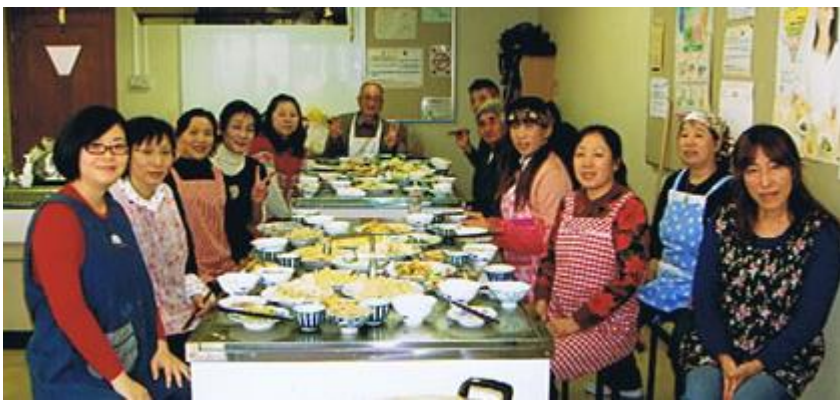
芳田日本語学習講座の忘年会、日中会員と帰国者