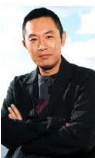
主演: 山本慈昭 内藤 剛志