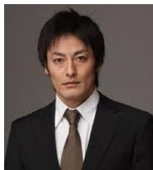
記者 依田 義彦 山口馬木也